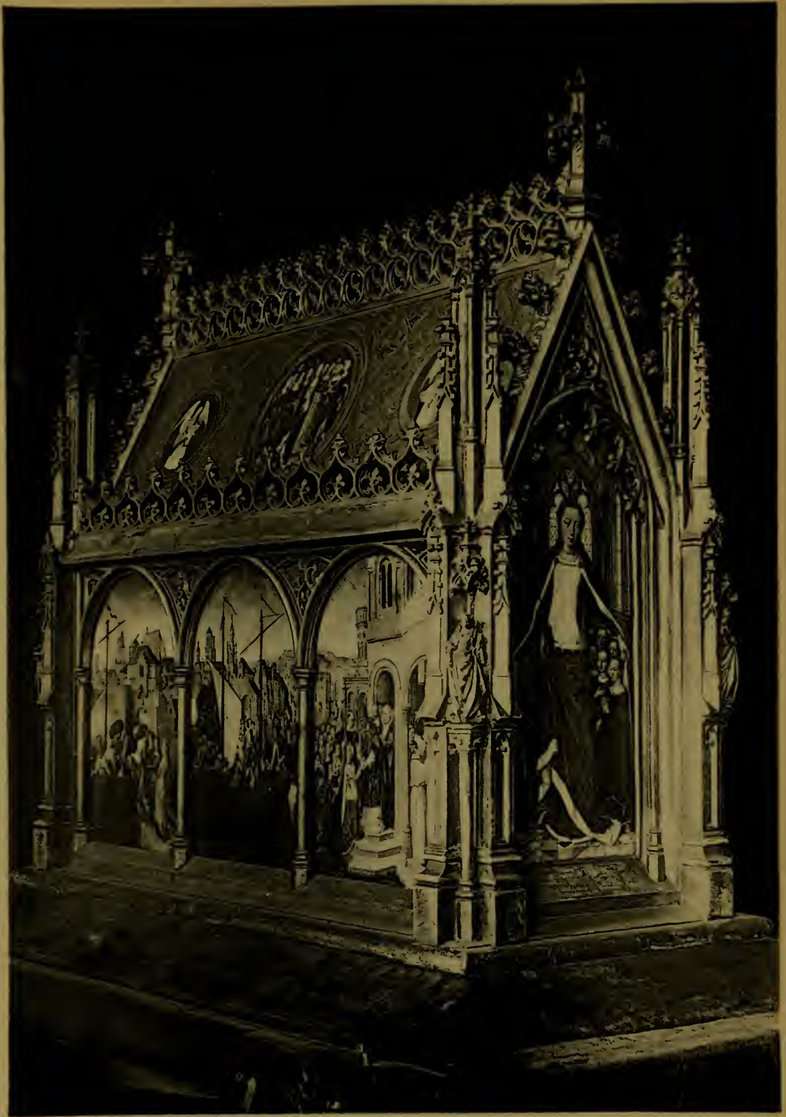
La Châsse de Sainte Ursule. (Vue d'ensemble).